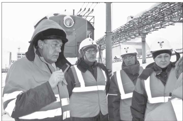
Аудит на промплощадке ПГУ