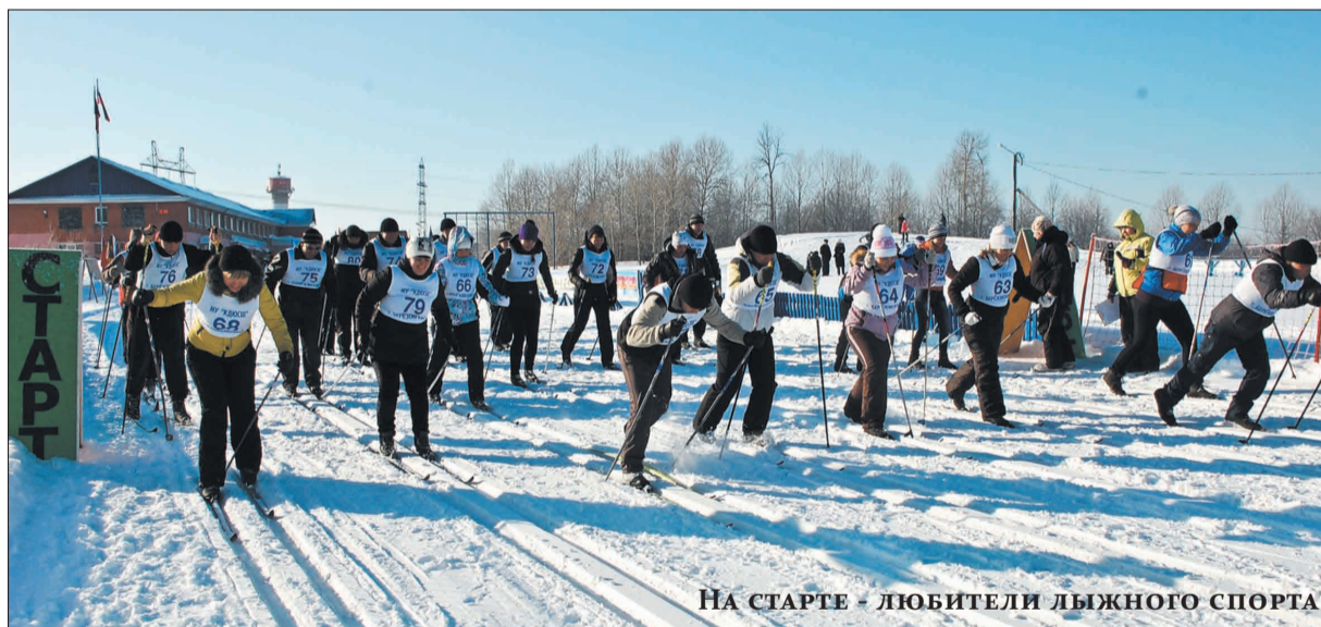
НА СТАРТЕ - ЛЮБИТЕЛИ ЛЫЖНОГО СПОРТА

Тех, кто очень сильно и не очень сильно замерз, в буфете ждал горячий чай с вкусной выпечкой. Главное, – все участники получили не только заряд бодрости, но и массу положительных эмоций.